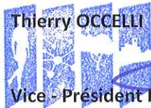
Vice-Président Délégué à la Mobilité et aux Transports

COMMUNAUTÉ D'AGGLOMÉRATION SOPHIA ANTIPOLIS